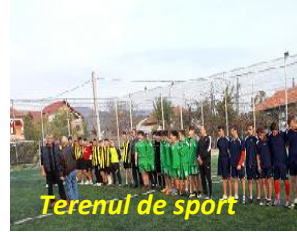
Terenul de sport