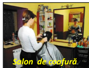
Salon de coafură