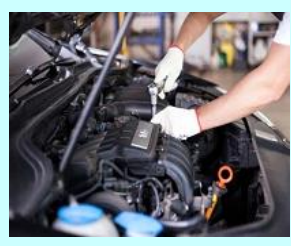
Atelier mecanic auto