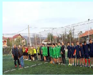
Terenul de sport