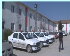
Parc auto Logan